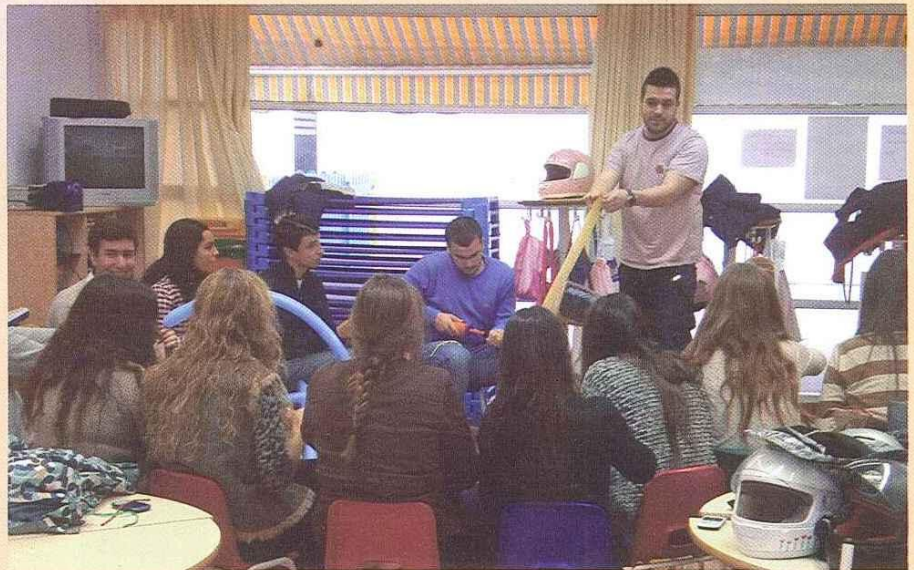
GRUPO DE PREMONITORES