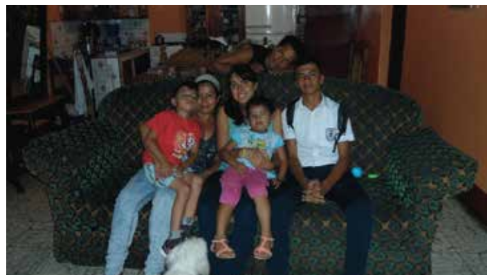
Sentirse en familia

Pero lo que me parece más importante de mi experiencia, es que allí lo que tenía no eran los títulos y cursos que habías realizado ni los méritos que habías acumulado. Te daban la oportunidad de participar en la vida del resto de personas según tu propia voluntad, motivación y compromiso. De esta forma, cualquier persona puede aportar algo al mundo.