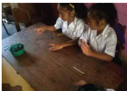
En la escuela

La participación e integración de los/as jóvenes en los diferentes programas y componentes institucionales de APAN les permiten crecer como personas, como profesionales, como ciudadanos/as del mundo capaces de transformar las realidades de los pueblos y las de ellos/as mismos/as compartiendo en todo momento sentimientos, emociones, trabajo y el intercambio intercultural con todos los entornos en los que han estado interactuando en su estadía de su campo de trabajo.