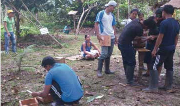
Estudiantes del Centro de Formación de Maestros Bilingües de la Amazonía peruana trabajando en su meliponario

“En el interior de la Amazonía peruana encontramos una ciudad mágica y llena de leyendas que me ha atrapado de por vida, Iquitos, a la que sólo se puede acceder por cielo o por agua”.