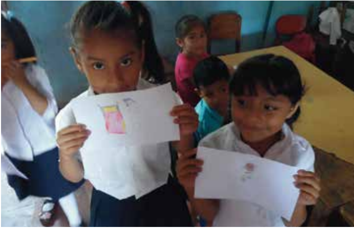
Talleres en la clase

tos sobre el tema y asegurar en mayor medida la continuidad del proyecto.