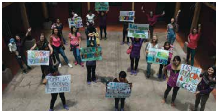
Reivindicación en el Día de la Manifestación #NiUnaMenos

Mantay son risas, sonrisas, miradas curiosas, lloros, gritos, jaleo, muchas personas alrededor de una mesa preguntando si hay aumento, harta ropa tamaño mini secando al sol y perros ladrando con cada llegada a casa. Festividades, bailes, corretadas, muchos colores, muchas ilusiones, y a veces también frustraciones. Es alegría, pero también rebeldía. Es reivindicación, protesta, no conformismo, lucha y dignidad. Es esfuerzo, trabajo, valentía, arte, constancia, entusiasmo y motivación. Es amor, es empatía y, sobre todo, es fuerza y energía de todas y cada una de las personas que desde allá y desde otros muchos lugares apoyan y hacen que este sueño sea posible.