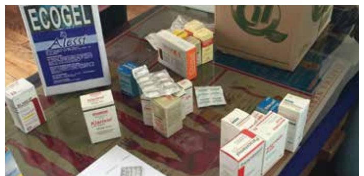
Preparación de fármacos

fármacos que tenían en la clínica, informábamos a los/as compañeros/as sobre cuál era el uso de cada fármaco, y los colocábamos por utilidad y fecha de caducidad en una estantería. Esta pequeña tarea resultó de gran utilidad, pues los días posteriores pasaron por nuestra consulta pacientes que pudieron beneficiarse de estas medicinas que habíamos ordenado, y que ahora teníamos a mano para poder dárselas a cada paciente.