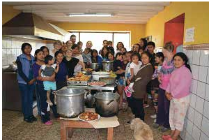
Mantay a la hora del almuerzo

Pero, y dejando un poco de lado el carácter más técnico, definir qué ha sido para mí Mantay y mi estancia en Perú es más complejo. No ha sido una experiencia meramente académica, ni mucho menos. Más allá de eso, ha sido una vivencia de crecimiento personal, de aprendizaje, de compartir, de disfrutar y conocer. Conocer de otras realidades y personas, sabores, olores, sonidos, formas y tiempos distintos que contemplar, de los que participar, formar parte, aprender y gozar.