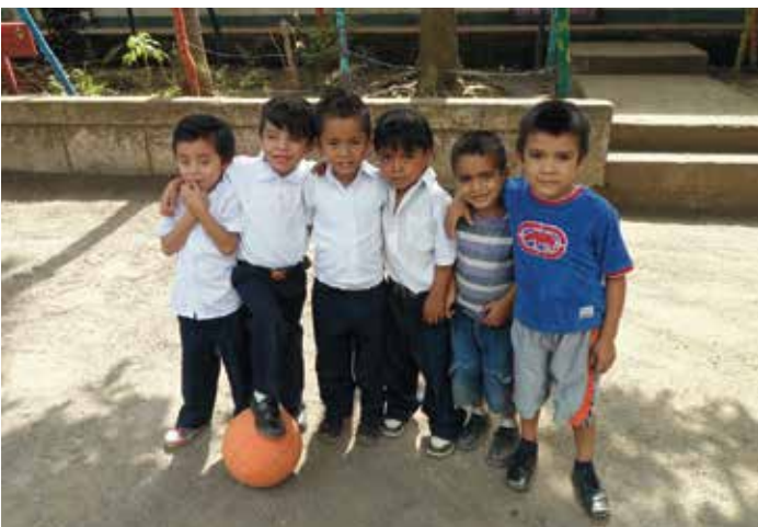
Niños de la Escuela

Un entorno de este tipo no deja lugar para prestar atención a temas como los sentimientos, debido a que existen otras necesidades básicas en las que invertir el tiempo. Por lo tanto, colaborar con APAN me facilitó el sitio, el tiempo y los elementos necesarios para desarrollar mi proyecto sobre “el trabajo de la educación emocional a través de actividades artísticas”, cuyo objetivo principal fue la colaboración a través de mi actividad docente en acciones de educación que APAN estaba desarrollando.