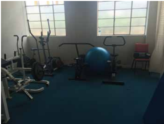
Organización APAINE (Asociación Para la Atención Integral de Niños Excepcionales)