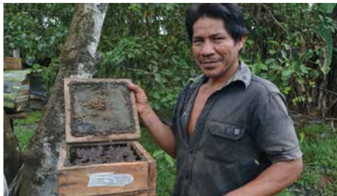
Meliponicultor de la comunidad de Llanchama haciendo la revisión de su nido

Otra experiencia inolvidable ha sido el acompañamiento de tres comunidades amazónicas que ya habían sido capacitadas, por lo que podemos hablar de familias meliponicultoras. Esta experiencia muestra el final del ciclo, cuando un meliponicultor llega al punto de autonomía en el manejo de abejas nativas. Es el fruto de un trabajo comenzado 4 años atrás y un bello ejemplo de proyecto de cooperación. También he tenido la suerte de realizar un precioso trabajo científico estudiando los pólenes de los que se alimenta una subfamilia de abejas muy comunes en la zona: la subfamilia de las meliponas (Meliponinae). Este trabajo ha exigido una parte de campo para la colecta de pólenes y otra parte de análisis en laboratorio. Al final de esta fase he sentido una satisfacción enorme no sólo por el aprendizaje científico, sino también por el interés y la pasión que esto despertaba en los meliponicultores.