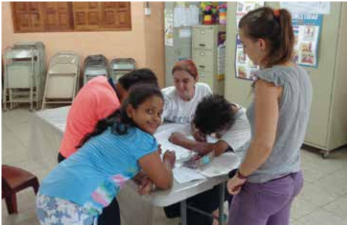
Taller de alimentación de las gallinas