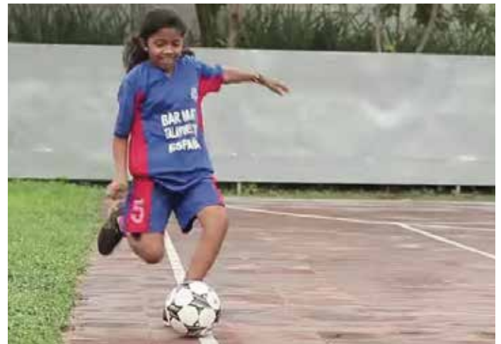
Jugando en la cancha

A mí personalmente me cambió la forma de ver el mundo. Gracias a mi voluntariado en VSF-Justicia Alimentaria Global, pude aprender más sobre las causas o el origen de las diferencias Norte-Sur, y la importancia de la Soberanía Alimentaria de los pueblos. Este viaje me ha permitido ver esa realidad con mis propios ojos y es justo lo que quería sentir. De esta manera el cambio que quería hacer en mi vida va viniendo solo. Gracias a esta experiencia, y junto con la formación que he adquirido estos años, soy cada vez más consciente de que simplemente con nuestra manera de consumir tenemos el poder de cambiar el mundo y hacer incidencia política para que los pueblos y las gentes tengan mayor soberanía sobre su alimentación.