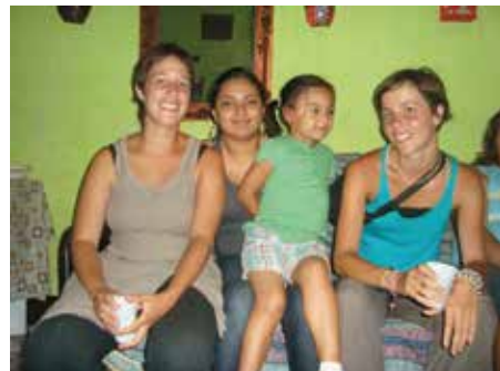
Convivencia de los estudiantes

lias nicaragüenses. De esta forma se comparten las vivencias cotidianas de la cultura nicaragüense y por ende la diriambina, y se da un buen intercambio, convirtiéndose el/la estudiante en un/a miembro más de nuestras familias y del Centro Social