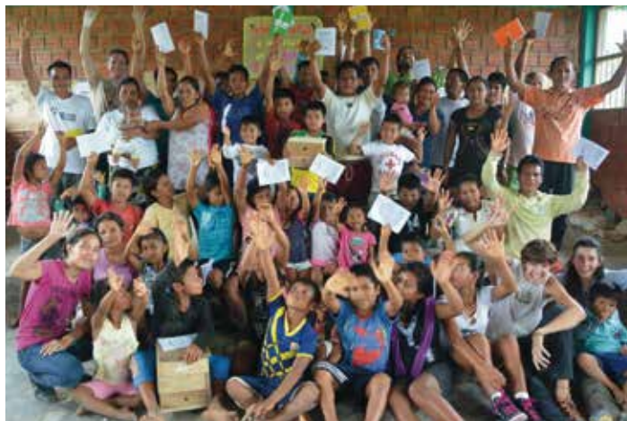
Alumnos de la Escuela Maijuna de Meliponicultura

incluso cómo multiplicar las colmenas. El interés de esta comunidad por proteger sus abejas y garantizar la polinización de sus bosques ha sido para mí un regalo, una muestra de esperanza e ilusión.