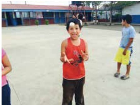
Niño en el colegio