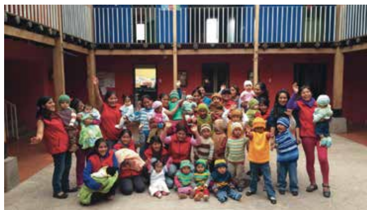
Patio de Mantay

“Mantay ya se sentía cálida desde España, pese a los más de 9000 km. que nos separan de Cusco”.