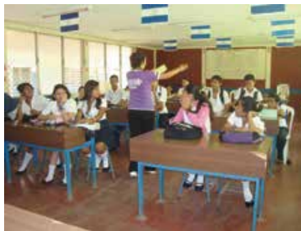
Clases en la escuela

comunidades rurales, mediante la participación activa de los actores de manera consciente, asesoramiento y acompañamiento con proyectos y planes concretos de desarrollo social con miras a la sostenibilidad.