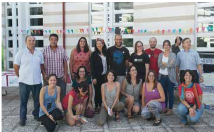
Foto con organizaciones sociales. Feria de Consumo Responsable 2016

“Las actuaciones que desarrollemos durante el período de esta Estrategia se fundamentan en la idea de que estamos inmersos en un modelo mal-desarrollador. El paradigma del desarrollo alcanzable a través del crecimiento económico ilimitado y continuo choca con la evidencia de los límites físicos planetarios. Seguiremos fomentando un modelo económico social equitativo y justo, que ponga en el centro a las personas y sus necesidades, que tenga en cuenta el trabajo del cuidado para llegar a satisfacerlas”. Estrategia de Cooperación y Educación para el Desarrollo de la UCO 2014-2017