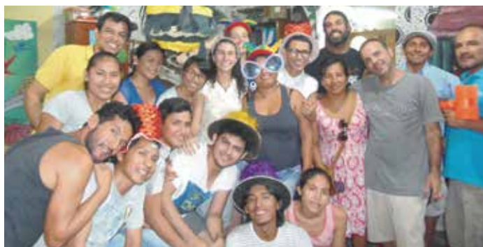
La familia de La Restinga

La última experiencia de la que me gustaría hablar es la de encontrar una familia (La Restinga) que te acoge y te protege, que te acompaña y que te empuja a crecer, a entender y amar sin límites.