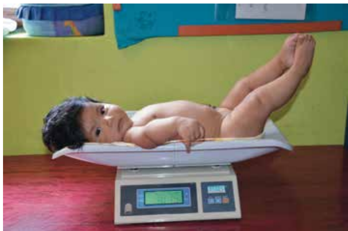
Seguimiento antropométrico infantil mensual