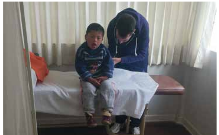
Relizando un examen médico

Acompañando a este estudio nutricional, los días que teníamos libres también los dedicábamos a organizar los