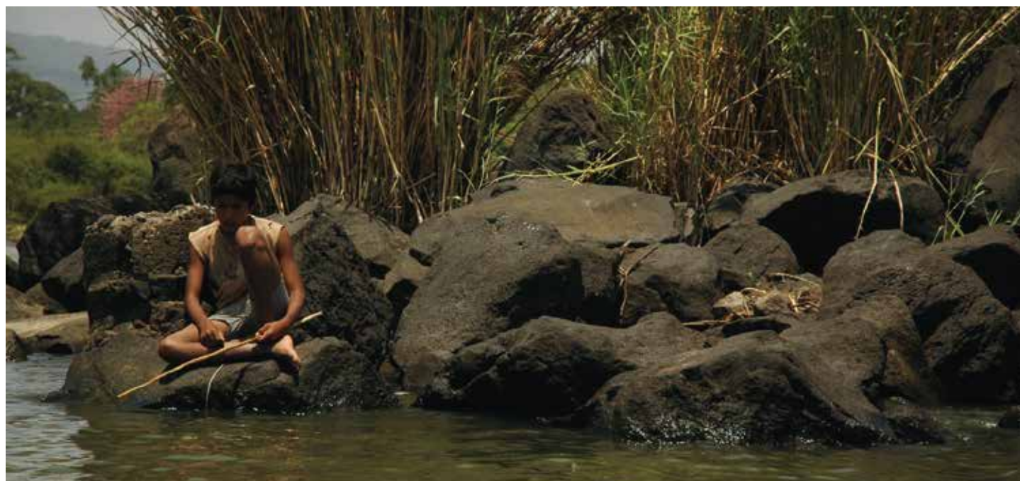
Después de clase

Son jóvenes que traen muchas visiones académicas que son sometidas al trabajo práctico diario, los cuales generan cambios positivos en sus vidas, y aprenden a convivir con las realidades del Sur. Siempre decimos que son aprendizajes mutuos. Tanto ellos/as como nosotros/as aprendemos y desaprendemos a diario y no es en vano cuando nuestro slogan institucional dice "APAN, una escuela