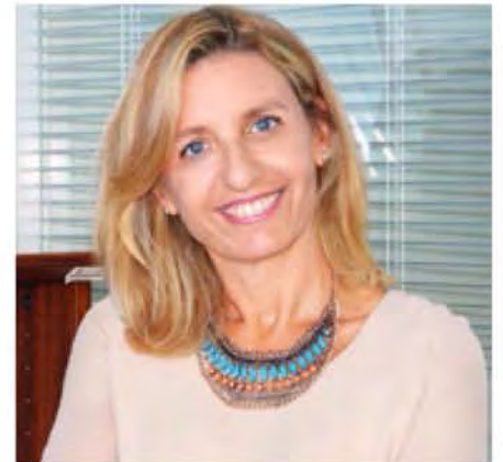
Delegada del Rector para la Igualdad de Género.

También la ONU, con este mismo objetivo, además de incrementar las acciones formativas a edades tempranas, dentro y fuera del sistema educativo, declaró a finales de 2015 el 11 de febrero como Día Internacional de la Mujer y la Niña en la Ciencia, de modo que esta jornada internacional pudiera servir de manera conjunta para visibilizar el trabajo de las investigadoras y para crear referentes para las futuras generaciones de científicas.